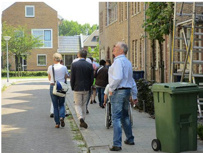
De wijkwandeling die aan de debatmiddag voorafging scherpte de discussie goed aan.